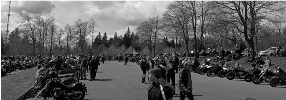
Ein besonderer Gottesdienst im Kirchenkreis

Kirche zöge keine Menschen an? – Fehlanzeige: Laut Werra-Rundschau besuchten 1000 Biker - am 6. Mai 2023 - die Ausfahrt zum Motorradgottesdienst auf dem Meißner. Eine beeindruckende Kulisse, die zeigt, dass viele sich nach dem Segen sehnen, wenn sie unterwegs sind auf zwei Rädern.